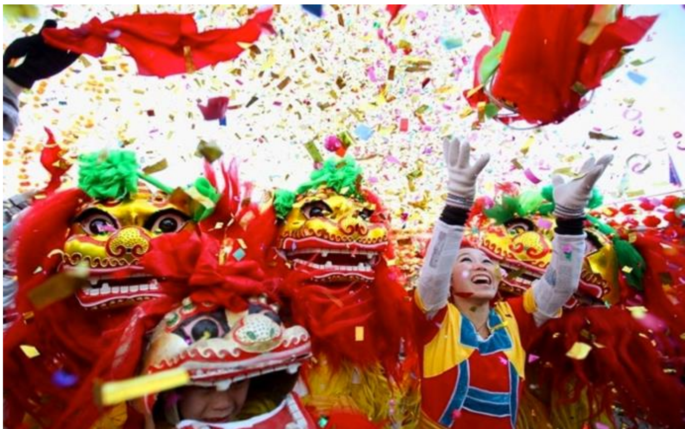
Semana Cultural China