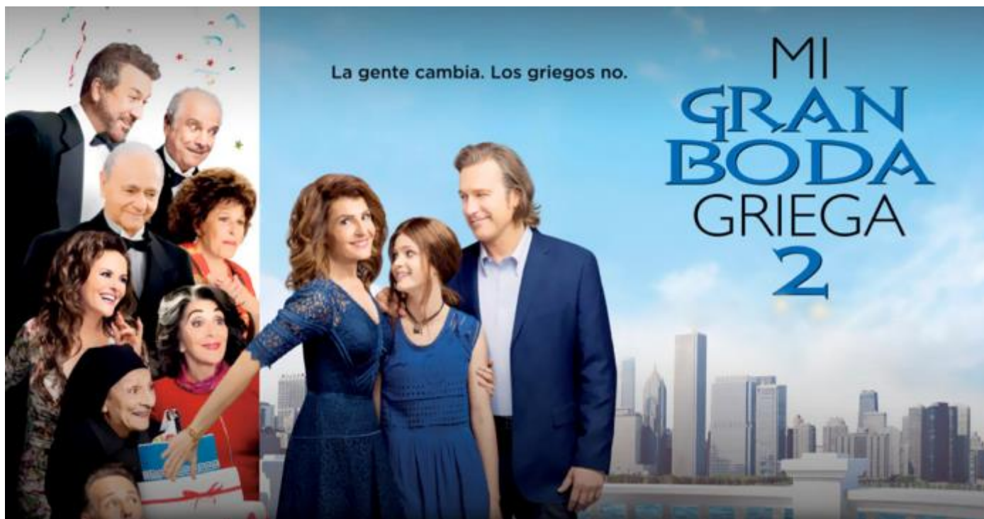
Mi Gran Boda Griega