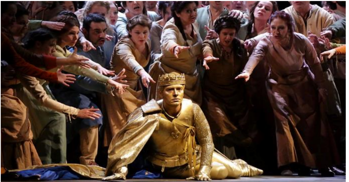
Giovanna de Arco (Giuseppe Verdi)