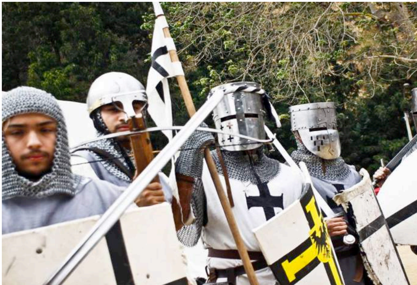
Feria Medieval y de Fantasía de Viña del Mar