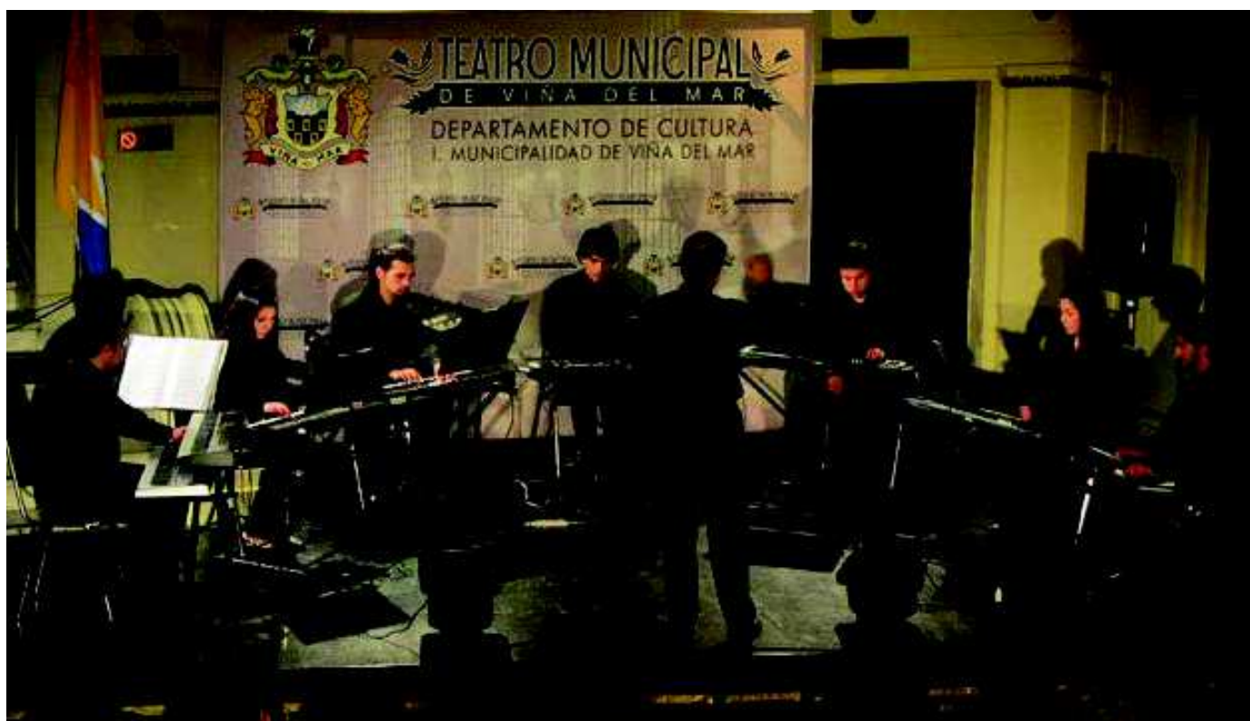
Concierto Ensemble de Sintetizadores Opus Musicum