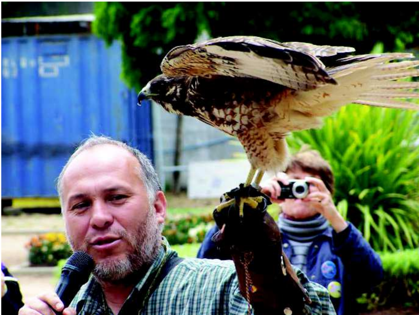
9º Festival de Aves de Chile, Viña del Mar 2016