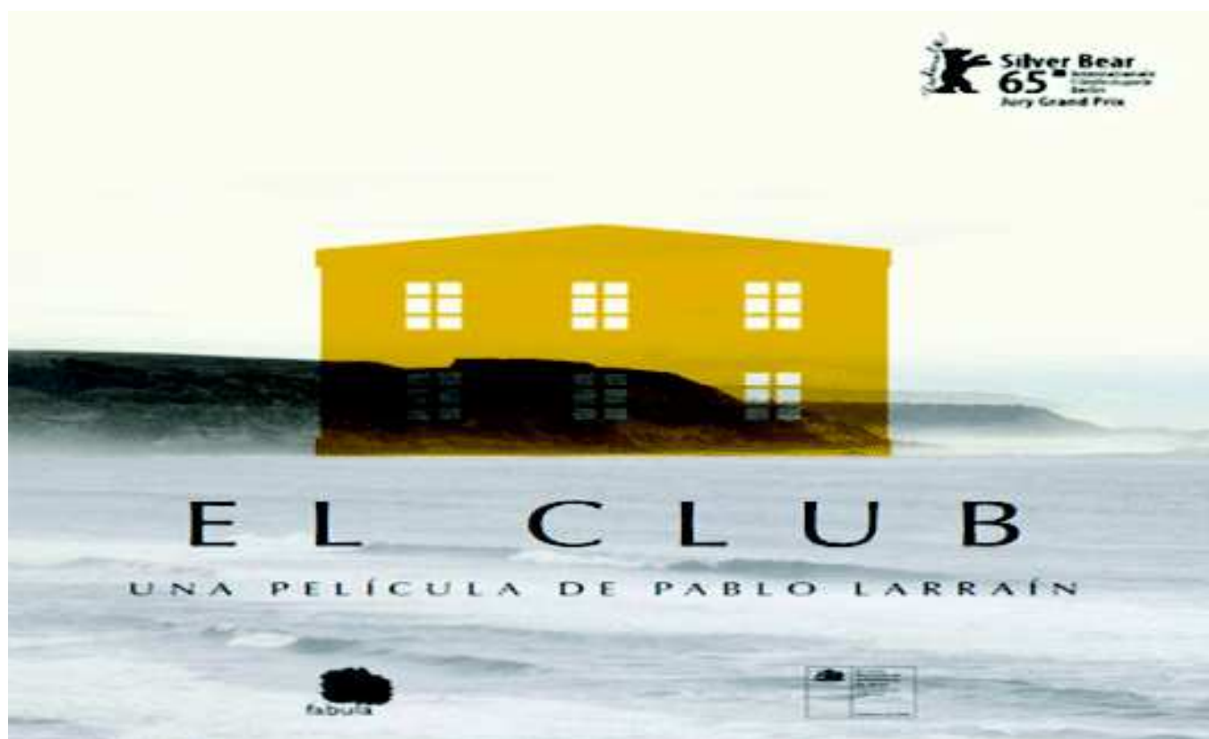
El Club / Pablo Larraín