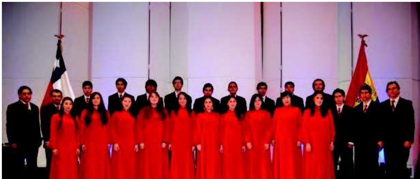
Coro de Cámara USM