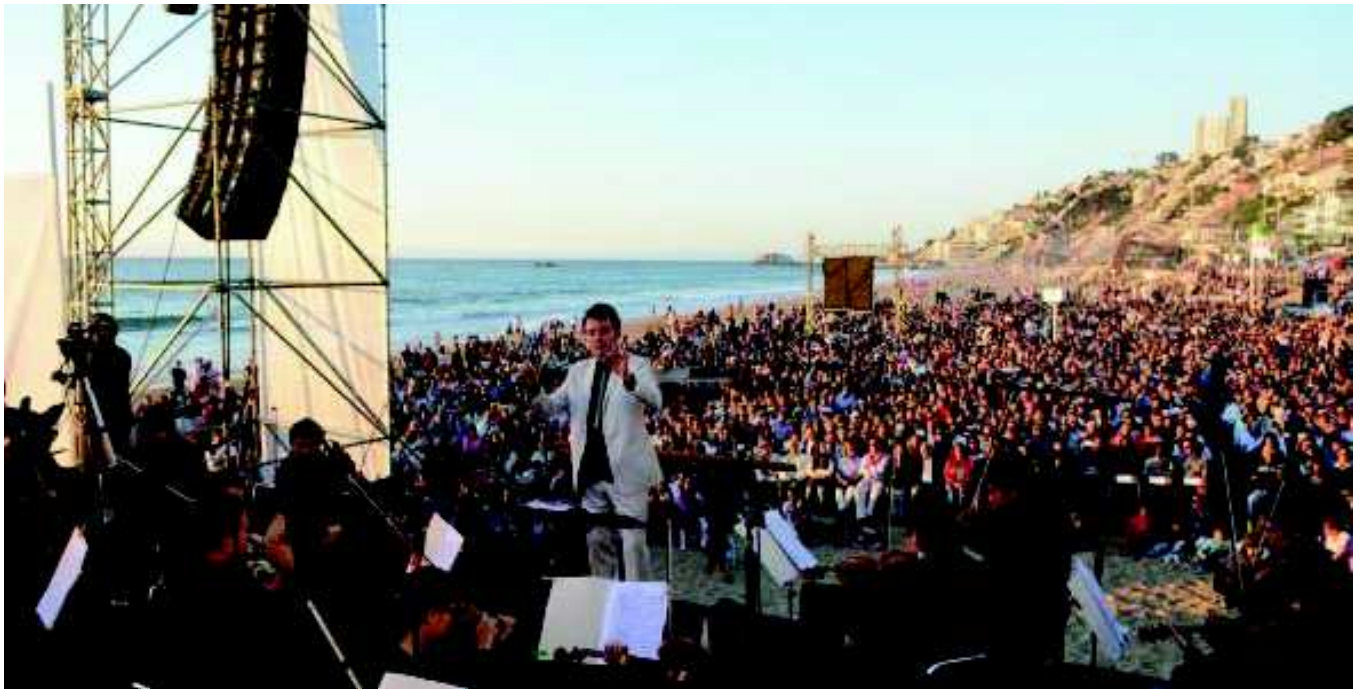
Concierto de Año Nuevo Reñaca