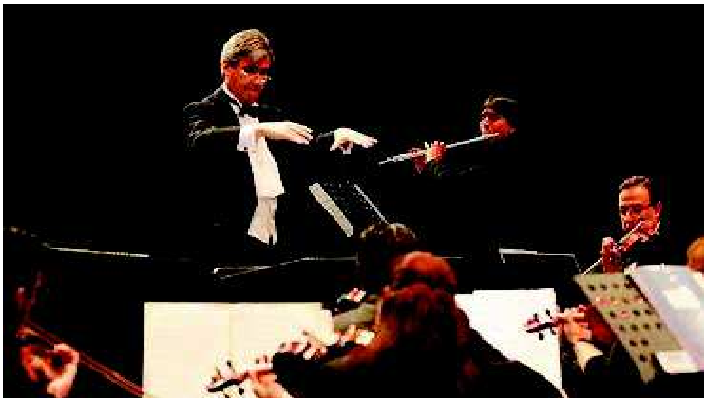
Orquesta de Cámara PUCV

Plaza Vergara s/n Fono:32 218 5426 / 32 2185432