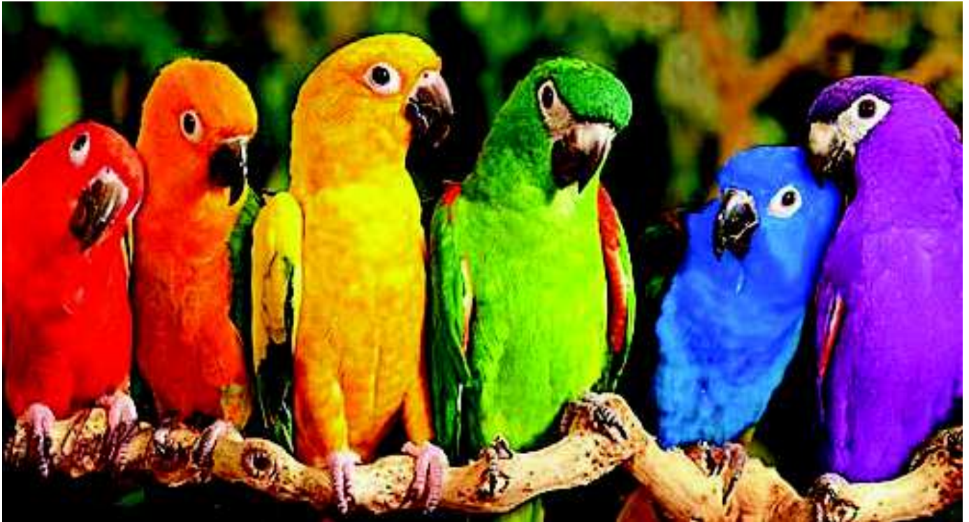
Aves en el Wulff