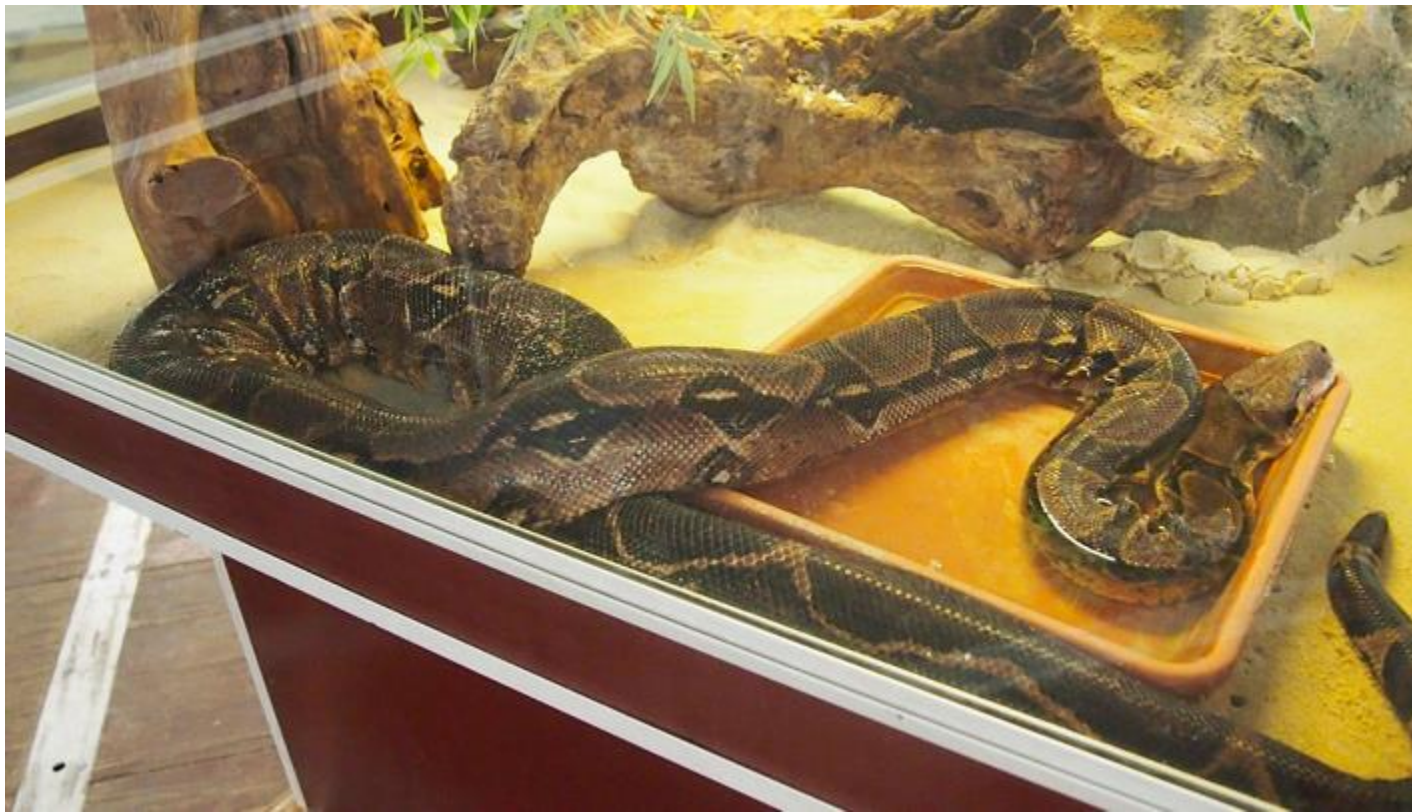
Expo Reptiles Vivos