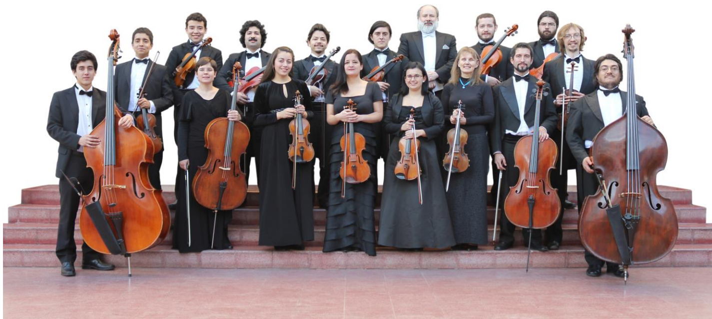
Orquesta Marga Marga

Plaza Vergara s/n Fono:32 218 5426 / 32 2185432