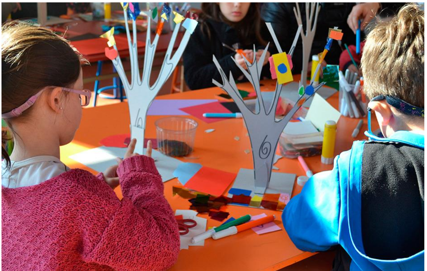
Taller aprendices en el arte

Viernes 29: Las huellas de la escultura: Confecciona diversos estilos de moldes para que captures las huellas del mundo.