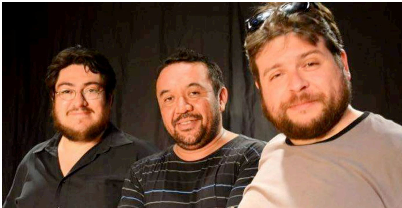
Agrupación Triangulo de las Bermudas Trío