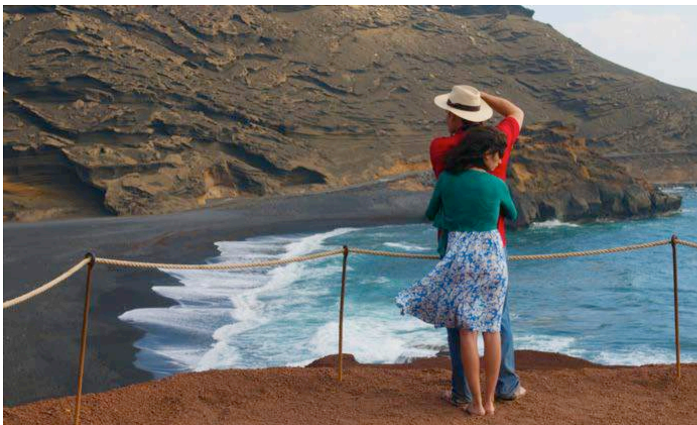
“Los Abrazos Rotos”

Organizan: Departamento de Cultura de la I. Municipalidad de Viña del Mar