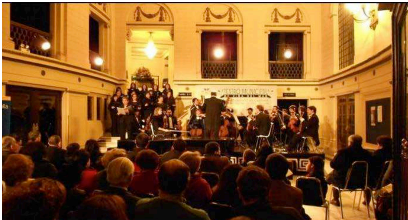
Temporada de Conciertos Conservatorio Sergei Prokofiev Viña del Mar

Plaza Vergara s/n Fono:32 218 5426 / 32 2185432