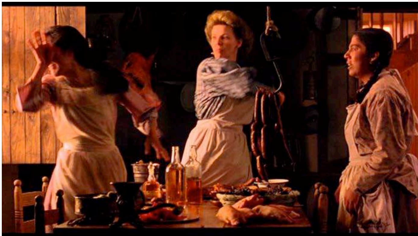
"Como agua para el chocolate"

Organizan: FICVIÑA: Departamento de Cinematografía I. Municipalidad de Viña del Mar y Escuela de Cine Universidad de Valparaíso.