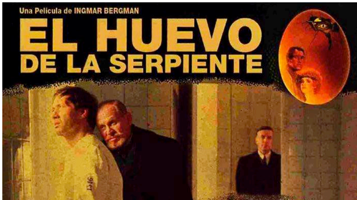
El Huevo de la Serpiente