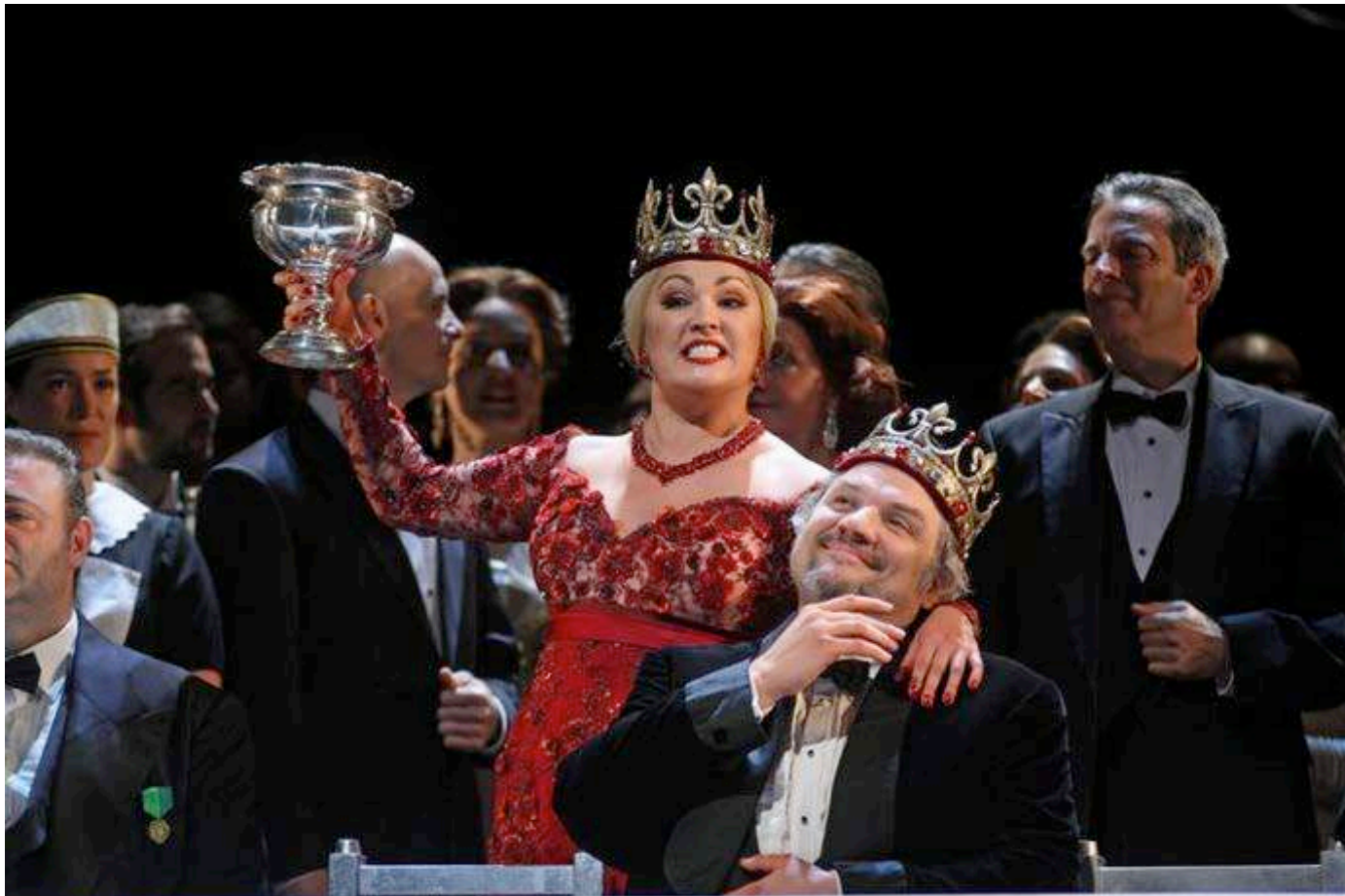
Macbeth de Giuseppe Verdi