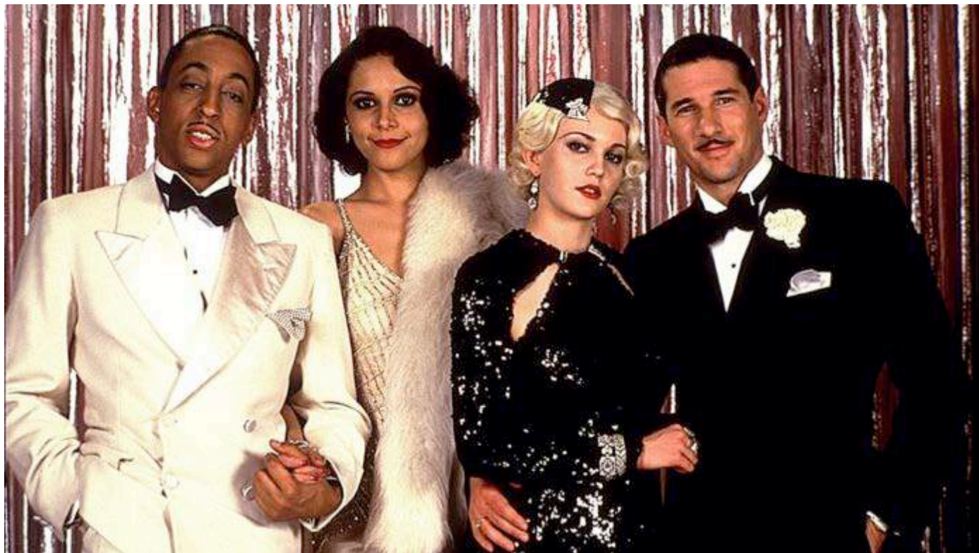
The Cotton Club