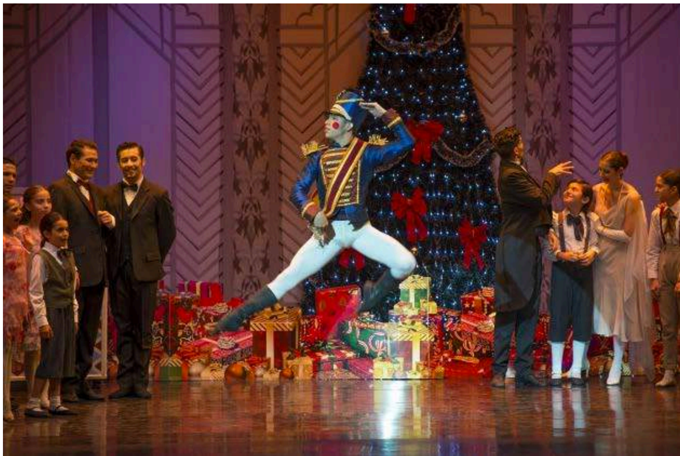
Ballet "El Cascanueces"