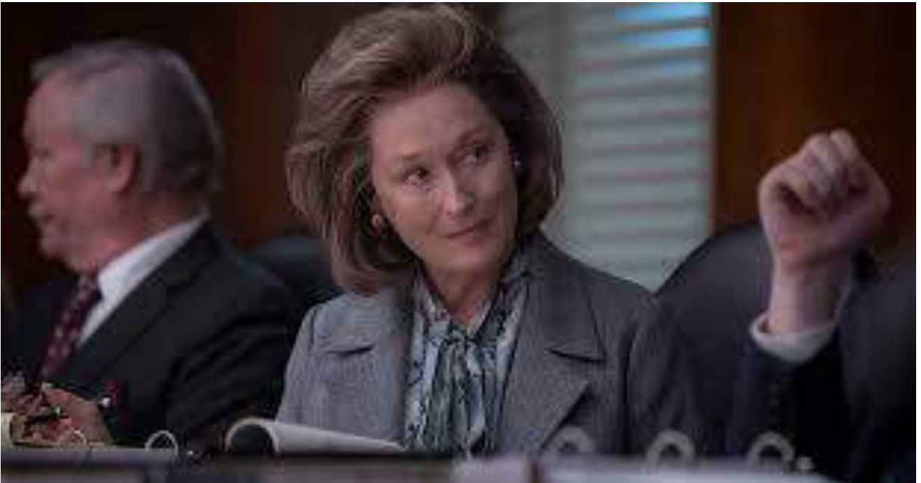
"The Post, Los Oscuros Secretos del Pentágono"