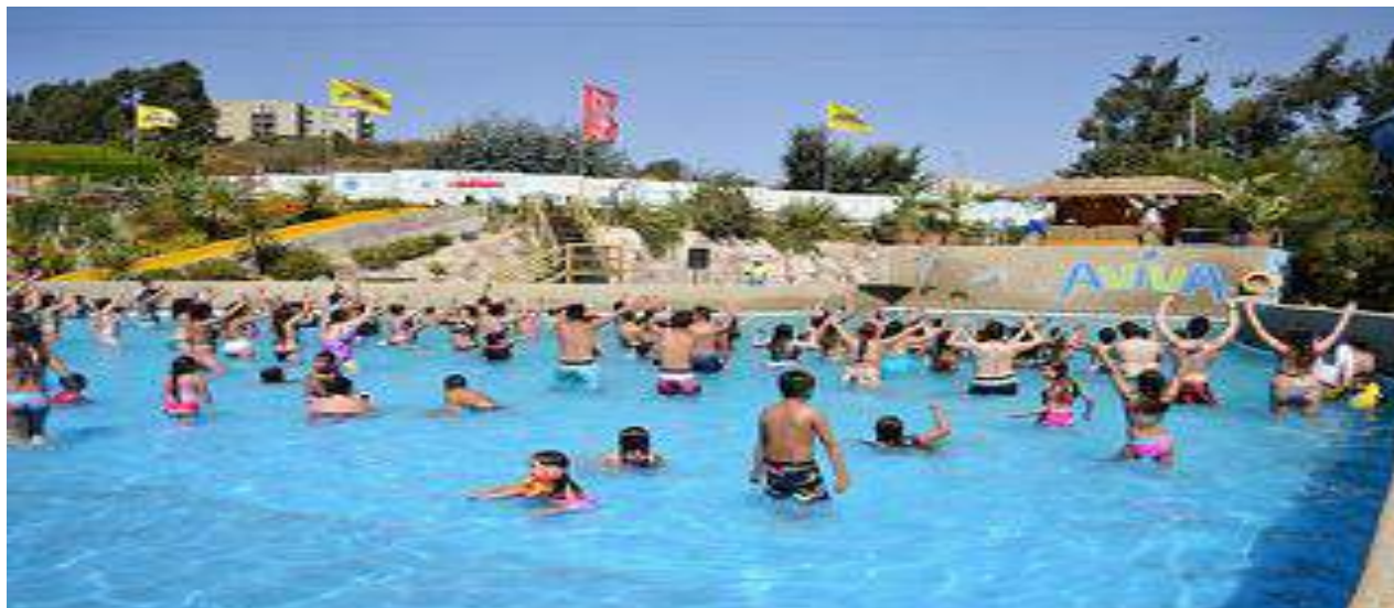
Parque Acuático de Viña del Mar