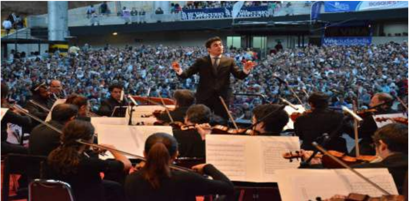
Conciertos de Verano