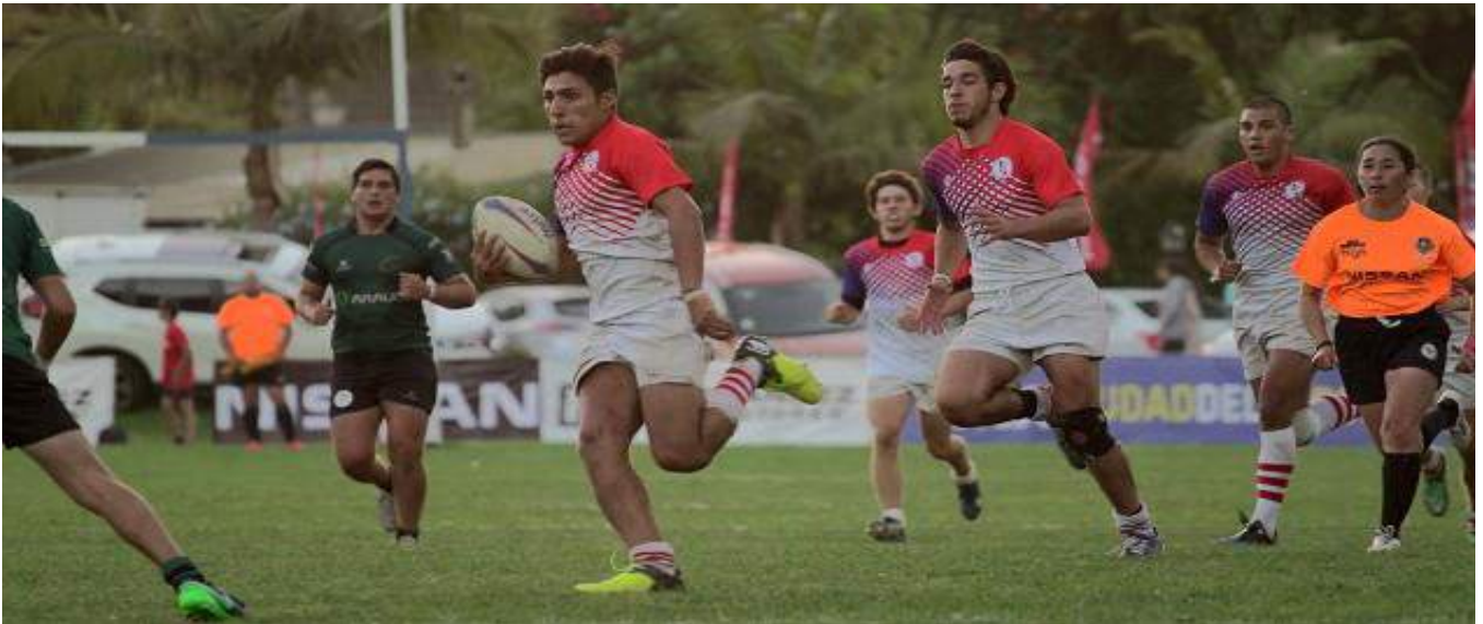
Seven a Side Juvenil