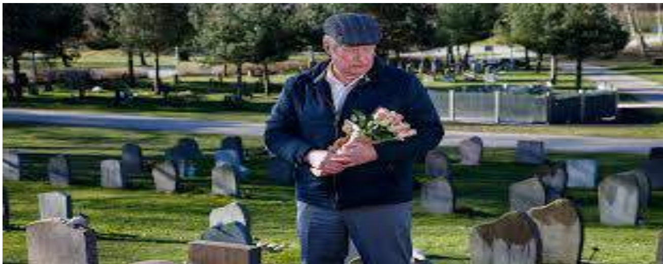
"Un Hombre Gruñón"