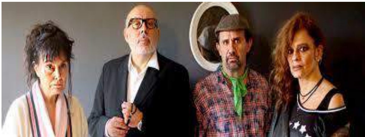
Hijos de su Madre