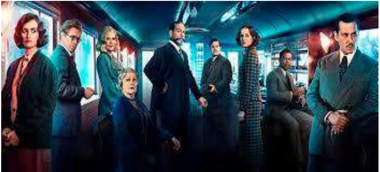
Asesinato en el Expreso Oriente