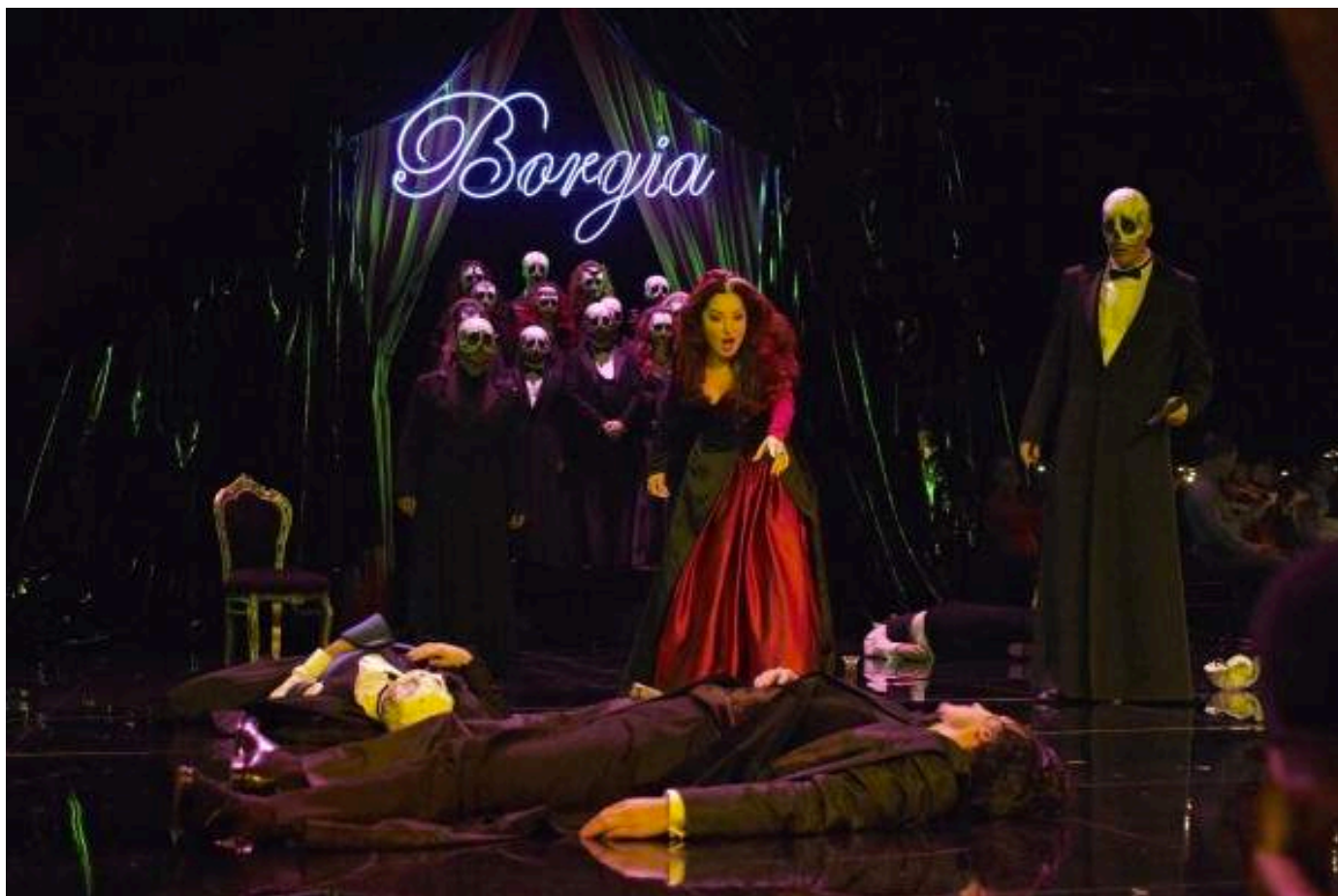
Lucrezia Borgia de G. Donizetti