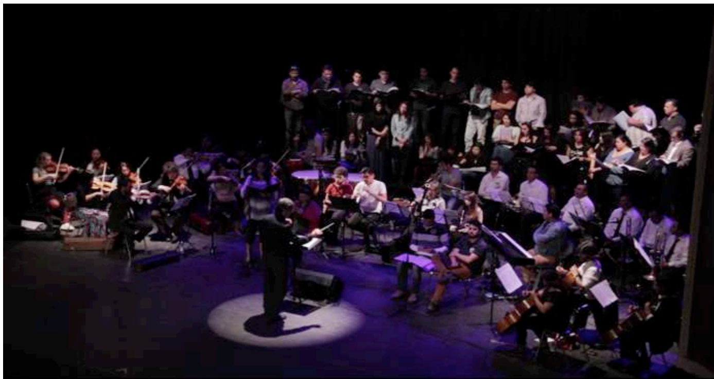
Coro de Cámara Universidad de Playa Ancha

Plaza Vergara s/n Fono:32 218 5426 / 32 2185432