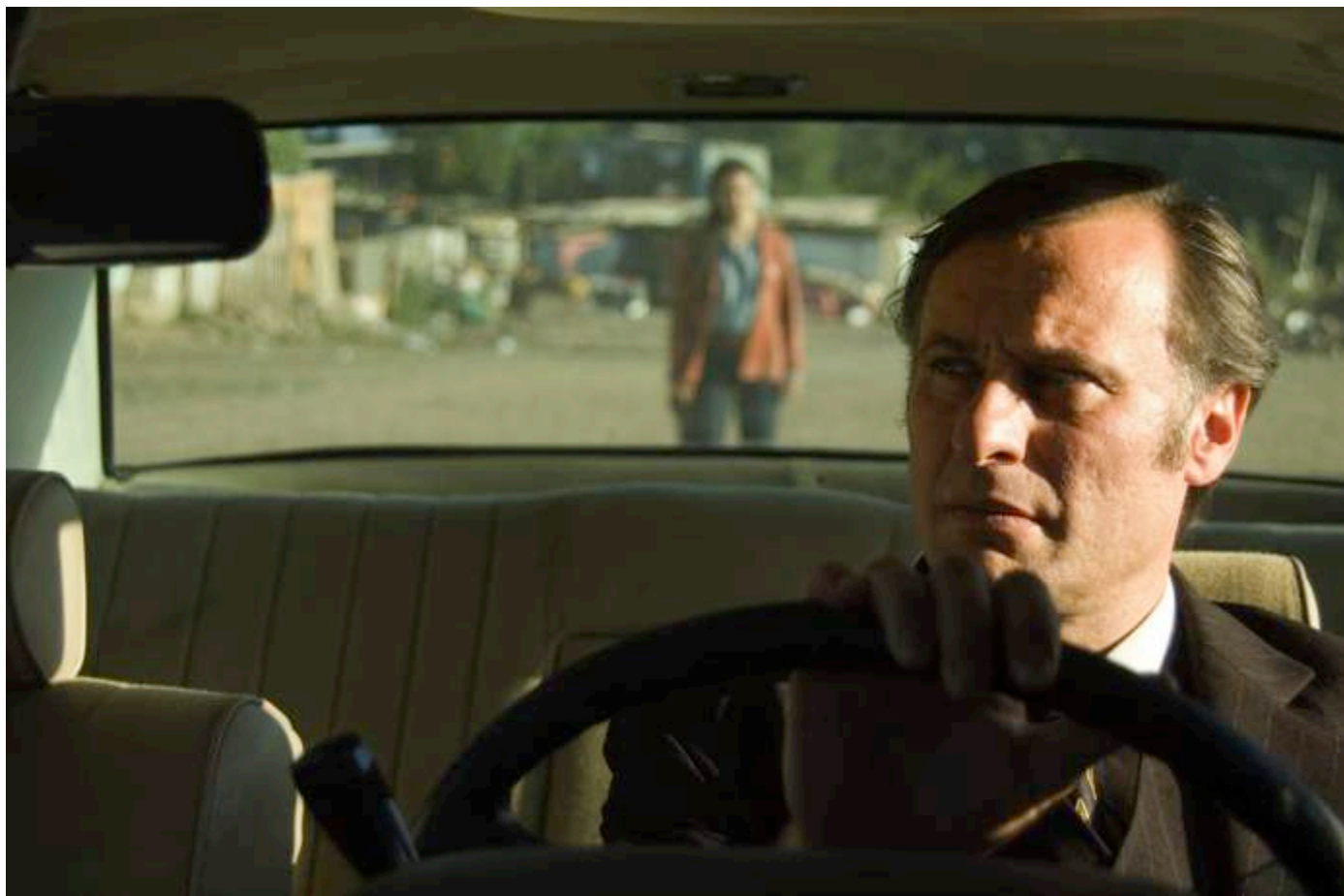
El Clavel Negro