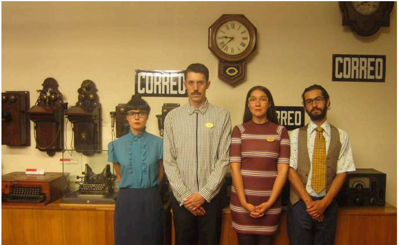
Obra de Teatro "Correo"