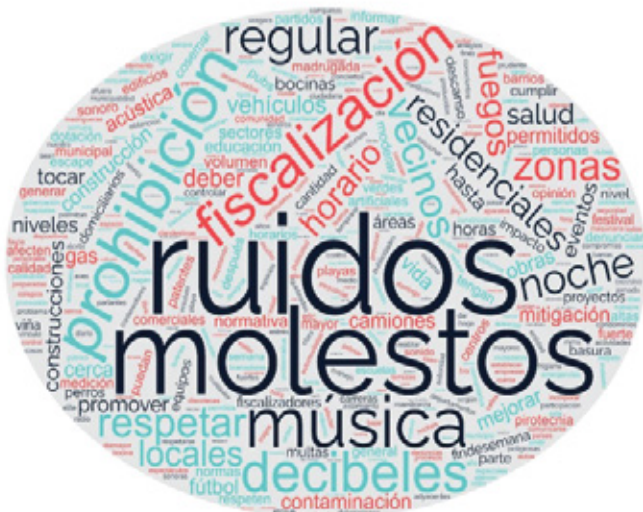
Imagen 4. "Nube de Palabras" – Eje temático Control del Ruido

En la siguiente "nube de palabras", se observa que se repite: ruidos molestos, fiscalización, música, respetar, residenciales, horario, decibeles, todo lo cual apunta a una regulación, prohibición y fiscalización de los ruidos generados por diversas fuentes, especialmente en horario nocturno y en zonas residenciales.