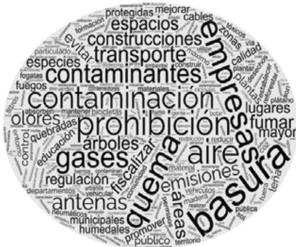
Imagen 3. "Nube de Palabras" – Eje temático Limpieza y Protección del Aire

Para el eje temático "Limpieza y Protección del Aire" se observa una tendencia similar en la mención a ciertos temas como es prohibición de quema, gases contaminantes, emisiones, basura, empresas (fiscalizar), construcciones, transporte, contaminación, antenas, fumar. Lo anterior, se ve reflejado en que lo principal en este punto es regular las emisiones de las empresas y sancionar a aquellas que lo hagan. Asimismo, definir espacios especiales para fumar (limitados), contar con buen manejo de residuos (principalmente orgánicos) para evitar malos olores y destaca el deber de las personas de mantener sus vehículos en buen estado para asegurar la no emisión de gases contaminantes.