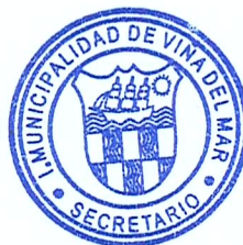
SECRETARIA MUNICIPAL (S)